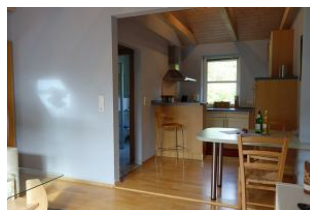
Der Blick in die Küche mit kleinem Tresen, dahinter verbirgt sich das Ceranfeld mit 4 Kochfeldern und der Backofen.