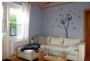
....nehmen Sie Platz.....