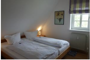
Das Schlafzimmer mit einem Doppelbett 180x200cm