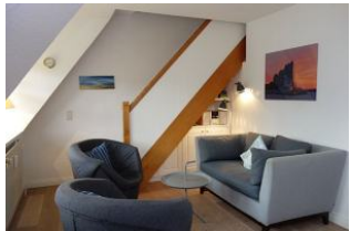
Gemütliche Sitzecke mit kleiner Couch und zwei Sesseln

Komfortable, in warmen Farben eingerichtete OG-Wohnung für 2-4 Personen. Auf halbem Weg zwischen Wyk und Nieblum steht dieses Reetdachhaus mit 4 Wohneinheiten. Wer die Ruhe sucht, den weiten Blick über Pferdekoppeln liebt, wohnt hier genau richtig. Das Meer ist so nah, man kann es fast riechen. Ideal auch für Golfer, denn der Golfplatz ist zu Fuß erreichbar.