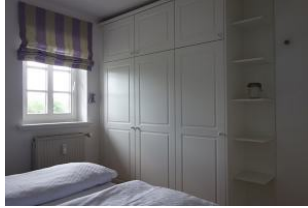
... und Einbauschränk, der alle Kofferinhalte aufnehmen kann.