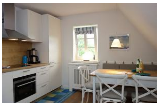
Der Esstisch mit Bank und drei Stühlen