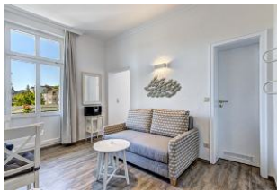
Couch im Wohnraum