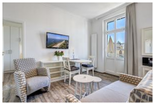
Blick in den Wohnraum

Wir bauen diese Wohnung bis Ostern 2021 für Sie um! Es entsteht direkt an der Strandpromenade - 1. Reihe mit SÜDBALKON - ein schönes 2 - Zimmer - Apartment im I. OG mit moderner Einrichtung, separater Küchennische, Duschbad, Südbalkon mit Sonne bis abends. Die Wohnung verfügt über einen Pkw-Stellplatz. In der Garage können Fahrräder und ähnliches untergestellt werden. Im Haus gibt es eine Sauna. Von der "Villa Germania" aus können Sie das Ortszentrum und die bekannte Ahlbecker Seebrücke in ca. 3 Minuten zu Fuß erreichen. Zum Strand sind es 50 m. Von Mai bis September ist ein Strandkorb im Tagespreis enthalten. Der Grundriss ist der der renovierten Wohnung. Die Bilder sind noch die der unrenovierten Wohnung und werden durch neue Fotos ersetzt, sobald diese vorliegen.