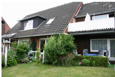
Das Haus "Pidder Lyng" mit den insgesamt 5 Wohneinheiten.