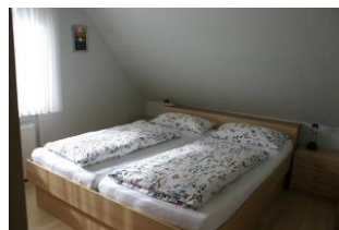
Das freundliche Schlafzimmer bietet erholsamen Schlaf in dem ruhigen Örtchen Utersum.