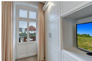
Flachbildfernseher im Schlafzimmer