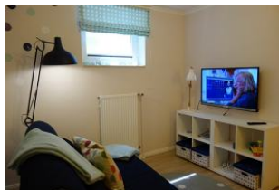
...TV Gerät und DVD Player