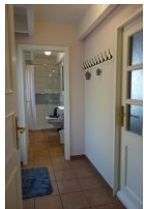
Der kleine Flur führt ins Bad. Rechts die Tür in die Garage, links die Tür auf die Terrasse