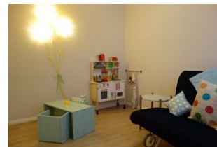
...und für unsere kleinen Gäste ein Tisch mit Stühlen und eine Spielküche