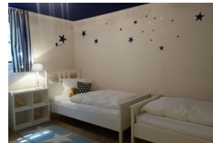
Das Schlafzimmer in der U 20 Zone mit 2 Einzelbetten 90x200cm, Sternenhimmel.....