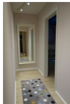
Der Flur führt rechts ins Schlafzimmer, links ins Spielzimmer