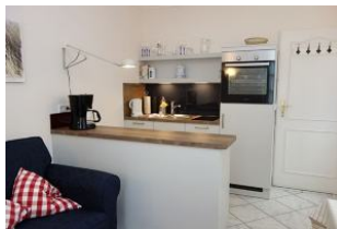
Die neue Küche mit Backofen und Geschirrspüler..