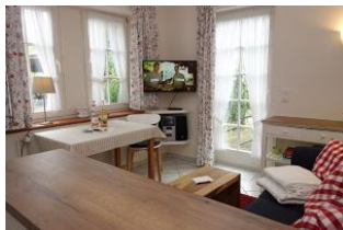
Esstisch und TV Gerät