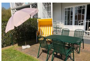
Der Garten ist eingezäunt.