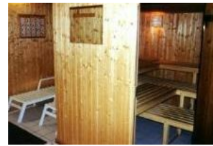
Die kleine Sauna im Keller des Hauses.