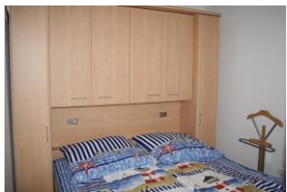
Das Schlafzimmer mit Doppelbett und viel Stauraum für Ihr Urlaubsgepäck.