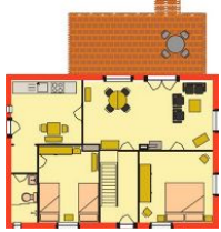
Der Grundriss der Wohnung im Erdgeschoss.