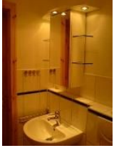
Das Tageslichtbad ...