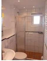
... mit großem Duschbereich