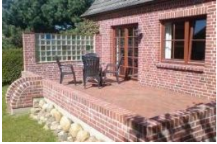
Ihre eigene Terrasse lädt zum Frühstück im Grünen ein.