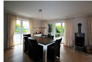
Der große Essbereich für gemeinsame Stunden