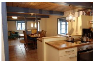
Ein Teil der Küche mit Blick auf den Essplatz und ins Wohnzimmer