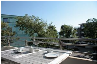
Bereits beim Frühstück auf dem Balkon können Sie den Blick auf die Nordsee genießen.