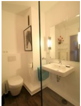
Das renovierte Badezimmer ...