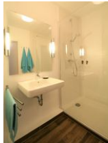
... mit großzügiger Dusche.