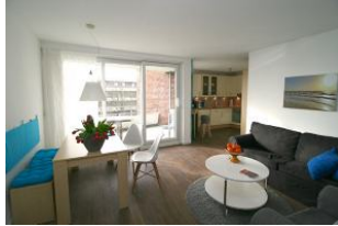
... mit direktem Ausgang auf den Balkon.