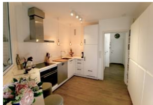
Die Küche ist bestens ausgestattet. Hier macht das Kochen Spaß.