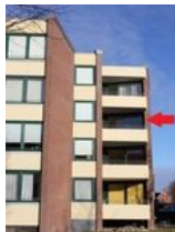
Im 2. OG befindet sich Ihre Wohnung, die mit dem Fahrstuhl ohne Anstrengung zu erreichen ist.