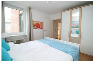
Ein großer Kleiderschrank steht Ihnen für die gesamte Urlaubsgarderobe zur Verfügung.

Herzlich Willkommen in der Ferienwohnung Strandmohn, im Haus Flora. Die Ferienwohnung liegt im 2. OG einer kleinen Apartmentanlage, die 60m 2 verteilen sich auf 3 Zimmer. Die Wohnung ist mit dem Fahrstuhl mühelos zu erreichen. Die Wohnung ist liebevoll und modern eingerichtet. Bereits beim Frühstück auf dem Balkon haben Sie eine wunderbare Sicht auf den Wyker Südstrand und die Nordsee. Der perfekte Ort um einen traumhaften Urlaub zu erleben! Wir freuen uns auf Sie!