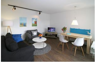
... mit Essecke und ...