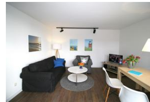
Das gemütliche und großzügig geschnittene Wohnzimmer ...