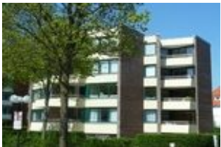
Das Haus von außen.