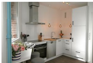
Die moderne Küche.