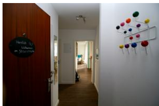
Ihr Eingang in das Urlaubsparadies.