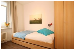
Das gemütliche Kinderzimmer