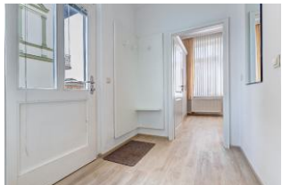
Eingangsfur mit Blick zum Schlafzimmer