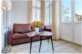
Wohnbereich in der Veranda mit direktem Gartenzugang und dortiger Terrasse