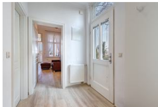
Eingangsfur mit Blick zum Wohn-/Essbereich