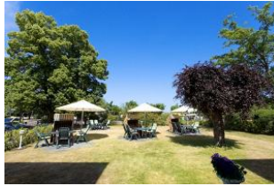
Garten mit Terrassen und Strandkörben (Mai bis September)