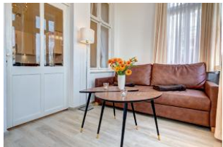
Wohnbereich in der Veranda