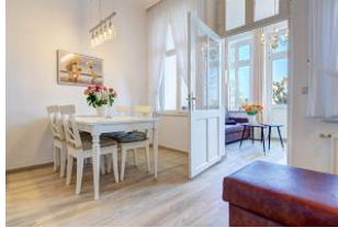
Essbereich und Lesecouch mit Blick zum Wohnbereich in der Veranda