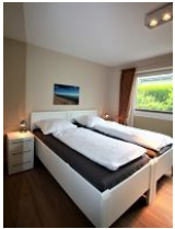
Das zweite Schlafzimmer mit zwei Einzelbetten ...