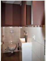
Das kleine und separate Gäste-WC