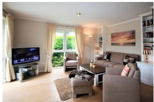
Das gemütliche Wohnzimmer

Herzlich Willkommen in dieser großzügig geschnittenen und hochwertig eingerichteten Ferienwohnung in diesem architektonisch einmaligen Haus. Die Ferienwohnung für bis zu 4 Personen befindet sich im Erdgeschoss. Ein kleiner blickgeschützter Garten ist direkt von Ihrer Terrasse zu betreten. Die Küche ist mit allem ausgestattet, was Sie für ein perfektes Dinner mit der ganzen Familie benötigen. Der offene Essbereich bietet viel Platz für gemeinsame Abende. Beide Schlafzimmer verfügen über einen eigenen Fernseher, im großen Schlafzimmer findet Ihre Kleidung Platz im begehbaren Kleiderschrank. Im Badezimmer finden Sie neben einer Dusche auch eine gemütliche Badewanne. Ein Carport für Ihr Auto steht auf dem Grundstück zur Verfügung.