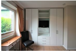
... und großem Kleiderschrank