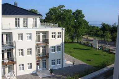
Hausansicht "Villa Aquamarina" von der Südseite (Nachbarhaus)