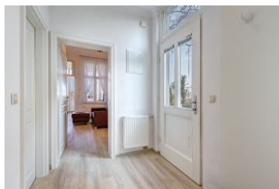
Eingangsfur mit Blick zum Wohn-/Essbereich