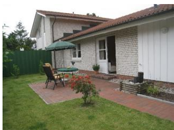
Haus Anna, Eingang + Terrasse mit.....