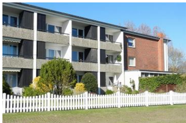
Das Matthias-Petersen-Haus von außen.