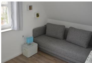
zweites Schlafzimmer mit Ausziehcouch und Schrankbett