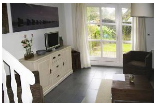
Ausgang zum gemütlichen Gartenteil

Verbringen Sie Ihren Urlaub in einem Haus in dem es Ihnen an nichts fehlen wird. Unser Hausteil bietet Ihnen ca. 60qm Wohnfläche auf 2 Etagen, einen separaten Eingang sowie einen eigenen Garten. Nieblum ist das schönste Dorf der Insel. Den historischen Ortskern erreichen Sie in 3 Minuten und zum Strand gehen Sie gemütlich ca. 10 Min. Im Sommer wie auch im Winter können Sie sich in unserem Haus wohlfühlen. Die Fußbodenheizung und der offene Kamin sorgen für eine gemütliche Atmosphäre.