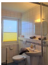
Bad mit Dusche