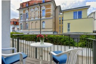
Balkon nach Süden