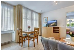
Wohnen, Essen, Blick zum Schlafzimmer