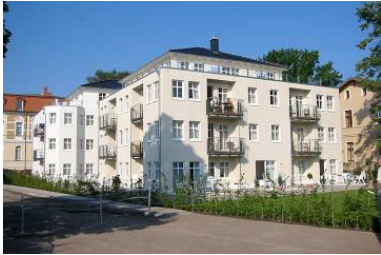
Hausansicht "Villa Aquamarina" von der Promenade