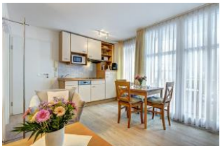
Küche, Wssen, Wohnen

1. Reihe, direkt an der Strandpromenade mit SÜDBALKON! FAHRSTUHL im Haus! Schönes 2-Zimmer-Apartment mit moderner guter Ausstattung. Separates Schlafzimmer (mit Fernseher), Wohnzimmer mit Küchenzeile mit Essplatz, Duschbad, Balkon zur Südseite mit Sonne bis abends. Die Wohnung verfügt über einen Pkw-Stellplatz. In der Garage können auch Fahrräder und ähnliches untergestellt werden. Von der "Villa Aquamarina" aus können Sie das Ortszentrum und die bekannte Ahlbecker Seebrücke in ca. 3 Minuten zu Fuß erreichen. Zum Strand sind es 50 m.