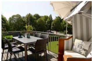
Balkon mit schöner Aussicht

Das Objekt Villa de Meere mit 8 individuellen Wohneinheiten befinden sich in Nieblum in einer ruhigen Seitenstrasse in der Nähe "de Meere", Der Ortskern ist in 1 min erreichbar. Gelegen in einer Seitenstr. habe Sie Blick auf den Nieblumer Ortsteich, den Sie von Ihrer grossen gemütlichen Dachterrasse sehen können. Nieblum ist das schönste Inseldorf von Föhr mit alten reedegedeckten Friesenhäuser, dem Friesendom und viele kleine Restaurants, Cafe?s und Einkaufsmöglichkeiten direkt im Ort. Alles fussläufig zu erreichen.