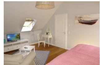
Schlafbereich 2 OG