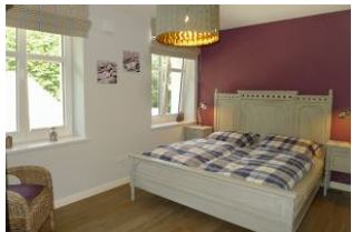
Schlafbereich im 1 OG