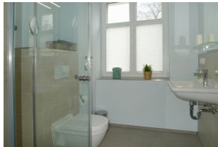
Badezimmer mit Dusche und WC