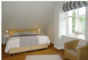
Schlafbereich im 2 OG