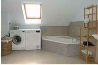
Badezimmer mit Badewanne und WC