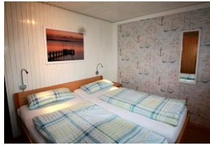
Der zweite Schlafraum im maritimen Look.