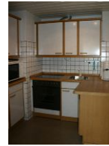
Die separate Küche ist ausgestattet mit Backofen, Geschirrspüler und Mikrowelle.