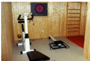
Der kleine Fitnessraum im Keller des Hauses.