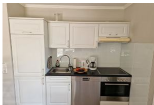
Die offene Küche mit Geschirrspüler und 4 Platten-Ceranherd mit Backofen schließt sich direkt dem Essplatz an.