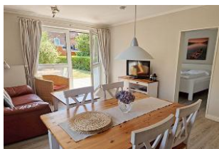
Flachbild-TV, DVD-Player und kostenfreier WLAN stehen zur Verfügung.