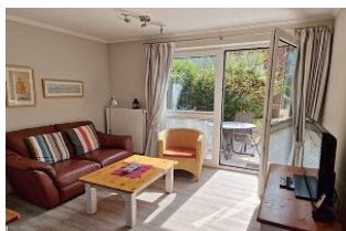
Das Wohnzimmer ist modern und freundlich eingerichtet.

Diese moderne Nichtraucher Ferienwohnung im EG des Vier-Parteienhauses Seeadler II ist ideal für den Urlaub einer dreiköpfigen Familie. Durch Fliesenböden und synth. Bettware ist die Wohnung gut für Allergiker geeignet. Den schönen Badestrand erreichen Sie in nur wenigen Schritten. Das Haus liegt in der verkehrsberuhigten Zone ruhig und zentral. Sämtliche Einkaufsmöglichkeiten, Restaurants, die Promenade und die Kureinrichtungen wie auch das AquaFöhr, liegen in unmittelbarer Nähe. Hier können Sie Ihren PKW kostenfrei parken.