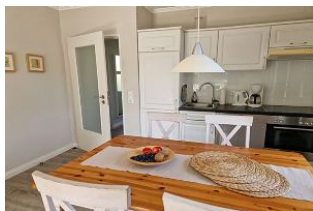
Der Essplatz ist für max. vier Personen gestaltet.