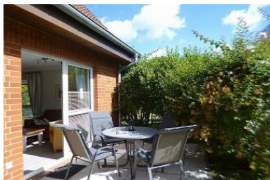
Die Unterkunft befindet sich im EG.

Auf der Süd/West Terrasse im kleinen Garten stehen Ihnen Gartenmöbel zur Verfügung (April - Okt.).