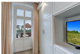
Flachbildfernseher im Schlafzimmer