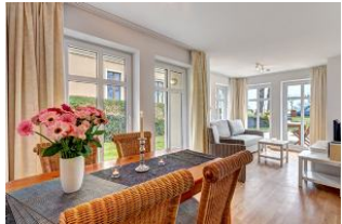
Essplatz und Blick in den Wohnbereich und zur Terrasse

1. Reihe, direkt an der Strandpromenade mit TERRASSE zur Seeseite! FAHRSTUHL im Haus! Schönes 3-Zimmer-Apartment mit moderner guter Ausstattung. Zwei separate Schlafzimmer, Wohnzimmer mit Essplatz, Küchenbereich, Duschbad, Gäste-WC, Terrasse zur Promenadenseite, zus. kleine Terrasse neben dem Eßplatz. Die Wohnung verfügt über einen Tiefgaragen-Pkw-Stellplatz. In der Garage können auch Fahrräder und ähnliches untergestellt werden. In unserer "Villa Germania" nebenan gibt es eine Sauna. Von der "Villa Aquamarina" aus können Sie das Ortszentrum und die bekannte Ahlbecker Seebrücke in ca. 3 Minuten zu Fuß erreichen. Zum Strand sind es 50 m.