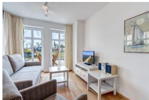
Wohnbereich mit Blick zur Terrasse