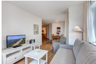
Wohnbereich mit Blick zum Essplatz