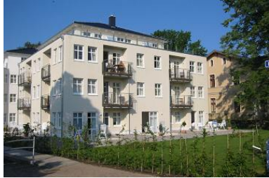
Hausansicht "Villa Aquamarina" von der Promenade mit Garten und Terrassen