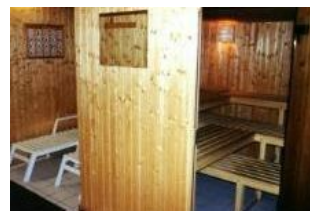
Die kleine Sauna im Keller des Hauses.