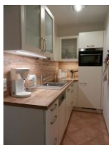
Die gut ausgestattete Küchenzeile.