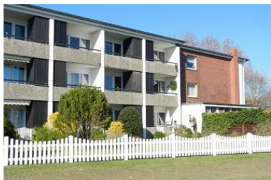
Das Matthias-Petersen-Haus von außen.