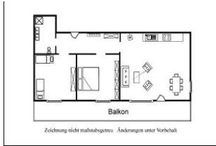
Der Grundriss der Wohnung