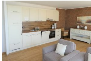
Die moderne und gut ausgestattete Küche