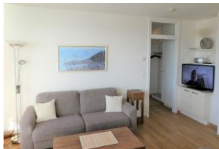
Die gemütliche Couch