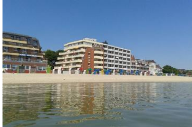
Das Haus von außen