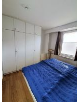
... und viel Stauraum für Ihr Urlaubsgepäck.