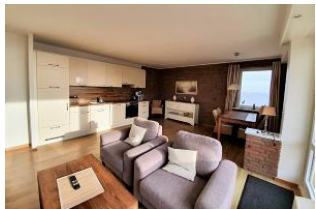
Das lichtdurchflutete Wohnzimmer mit offener Küche.

Diese traumhafte Ferienwohnung mit großartigem Meerblick befindet sich im 4. OG und ist für max. vier Personen ausgelegt. Die ca. 70 qm große Wohnung ist mit einem Fahrstuhl ganz bequem zu erreichen. Sie verfügt über zwei Schlafzimmer und einen sehr gemütlichen Wohn - Ess- Bereich mit offener und vollausgestatteter Küche. Auf dem Balkon wartet ein schöner Strandkorb auf Sie. Die Promenade und die Innenstadt sind nur einen Katzensprung entfernt. Sie wohnen ruhig und sehr zentral. So macht der Urlaub Spaß.