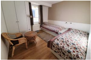
Das Kinderzimmer mit zwei Einzelbetten.