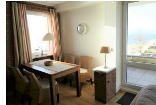
Der Essbereich mit Meerblick