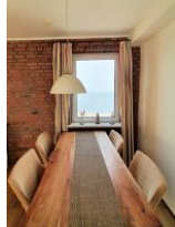
Der Essbereich lädt zu schönen gemeinsamen Stunden ein.