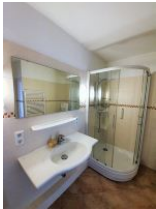
Das geräumige Duschbad verfügt auch über Waschmaschine und Trockner.