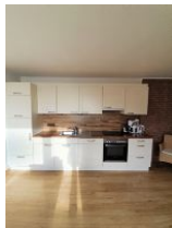
Die Küche ist gut ausgestattet.