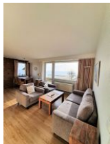
Das geräumige Wohnzimmer mit Meerblick.