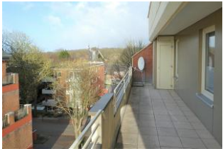
Der Blick vom Balkon auf die Wyker Mühle