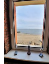
Der Blick aus dem Fenster auf die Nordsee