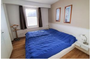
Das Schlafzimmer mit Doppelbett...