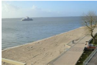
Der Blick von Balkon auf die Nordsee