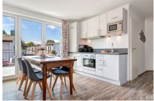
Küche und Essplatz