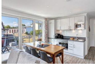
Küche und Essplatz