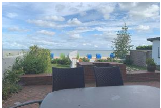
Die überdachte Terrasse ist möbliert.