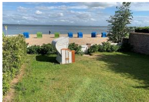
Der Garten mit überdachter Terrasse, Strandkorb (April-Oktober), Gartenmöbeln und direktem Strandzugang steht Ihnen zur alleinigen Nutzung zur Verfügung.