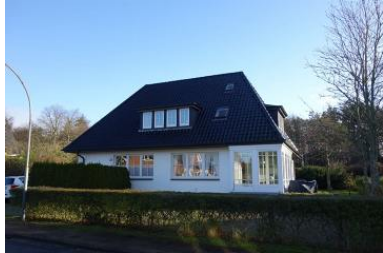
Das Haus Schwalbenweg 10 Die Whg. 1 befindet sich rechts im Haus