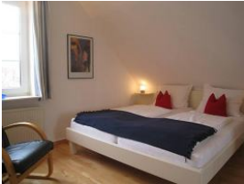
Das großes Doppelbett 180x200cm garantiert erholsamen Schlaf.