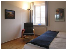
Ein gemütlicher Sessel zum schmökern...