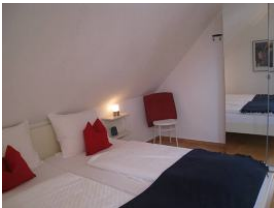
Doppelbett, im Hintergrund der Kleiderschrank mit großem Spiegel