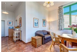
Wohnen und Essen