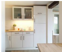
...und der andere Teil für Geschirr etc.