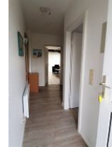
Der Flur der Wohnung.