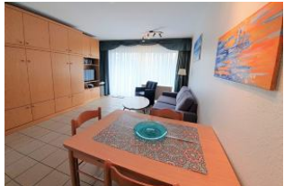
Das Wohnzimmer mit direktem Ausgang auf die eigene Terrasse

Die Ferienwohnung Wattwurm liegt in einer bevorzugten Lage von Wyk. Ruhig und doch zentral, fußläufig zur Promenade, der Innenstadt, dem Wellenbad mit seinen Kureinrichtungen oder zum Südstrand. Diese niedliche Wohnung befindet sich im Erdgeschoss. Sie bietet Platz für bis zu 4 Personen und hat 1 kleines Schlafzimmer mit einem kleinen Doppelbett ( 140/ 190) und einem Schrankbett ( 2X 80 / 190) im Wohnbereich. Das Wohn- Ess- Zimmer beinhaltet auch die vollausgestattete Küche mit dem Ausgang auf die eigene Terrasse. Ihre Wohnung hat ein Tageslichtduschbad mit Toilette. Dies ist ein Ort zum Wohlfühlen und Erholen.