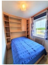
Das Schlafzimmer mit kleinem Doppelbett