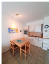
Die Küche ist klein, aber gut ausgestattet