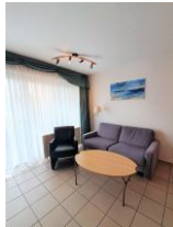
Die Sitzecke im Wohnzimmer.