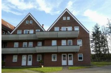
Das Haus von außen, die Wohnung befindet sich im EG.