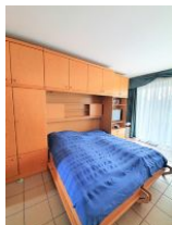
Das Schrankbett im Wohnzimmer bietet Platz für 2 Personen.