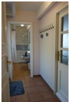
Der kleine Flur führt ins Bad. Rechts die Tür in die Garage, links die Tür auf die Terrasse