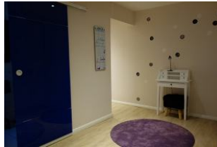
Hinter der Glastür verbirgt sich ....