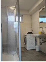
Kleines Bad mit Waschmaschine, Dusche und WC