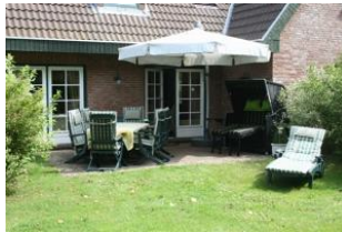
Die herrliche, geschützte Terrasse mit Gartenmöbeln und Strandkorb