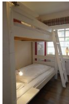
noch einmal die Betten im Kinderzimmer, klein und urgemütlich !