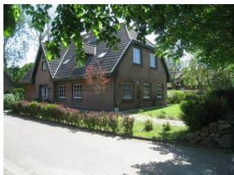
Das Haus 151 in Oldsum