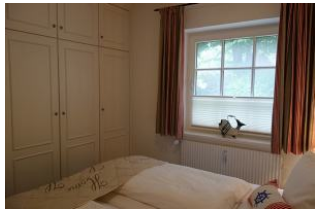
...mit viel Schrankfläche für die Kofferinhalte