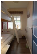
Das kleine Kinderzimmer mit Etagenbett. Ab 2024 wird dort ein Einzelbett stehen, dann können wir nur noch an 3 Personen vermieten.