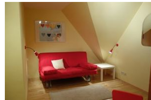
Das Durchgangszimmer mit moderner Couch zum lesen und klönen....