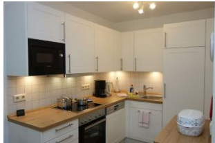
...mit viel Platz für Küchenutensilien