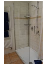
.. großer Dusche, Echtglaswand.