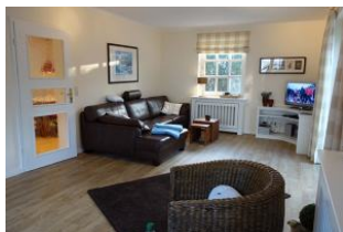
...die Tür führt in die Küche.