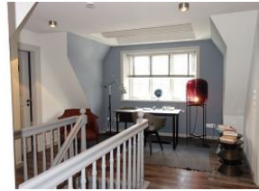
Der Flur im OG mit Schreibtisch für kreative Gedanken.