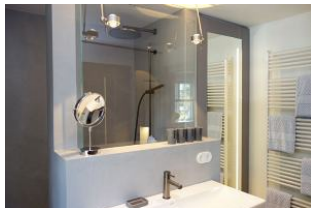
...hinter dem großen Spiegel verbirgt sich ....