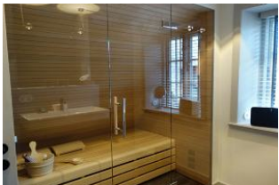
Im Bad integriert, die Sauna