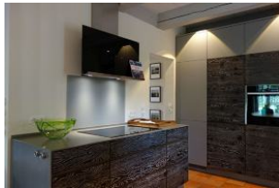
Das Vollinduktionsbedienfeld, hier kocht es sich fast wie von allein