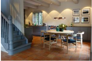
Der Essplatz mit Blick zur TV - Sitzcke oder zur Küche