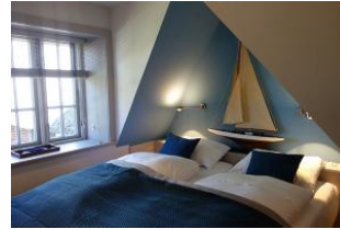
Das Doppelbett im "blauen" Schlafzimmer...