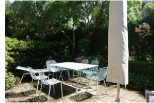
...herrlich eingewachsene Terrasse, Tisch und Stühle, 2 Liegen.