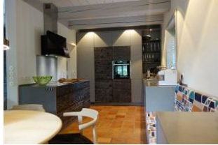
Die offene, hochmoderne Küche...