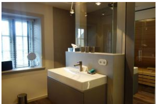
Das Bad im Obergeschoss. Hinter der Glaswand befindet sich .....