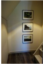
...hier finden Sie Schränke für Ihre Kofferinhalte und hier geht's hinauf ins Dach in die gemütliche Lesecke