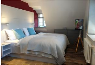
Das große Doppelbett im "roten" Schlafzimmer, TV