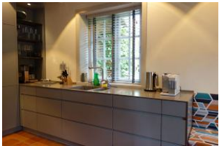
Ein Teil der Küche, hier die Spüle