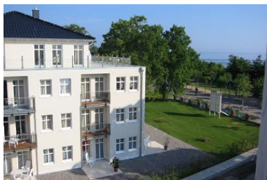
Hausansicht "Villa Aquamarina" von der Südseite (Nachbarhaus)