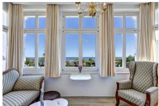
Veranda mit Seeblick