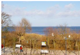
Seeblick aus der Veranda