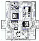
Wohnungsgrundriss (Möblierung exemplarisch)