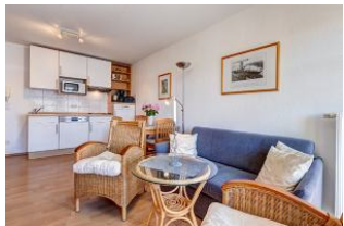
Wohnbereich, Essbereich, Küchenzeile