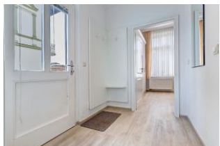
Eingangsflur mit Blick zum Schlafzimmer