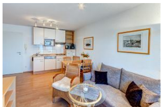
Wohnbereich, Essbereich, Küchenzeile