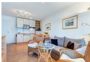
Wohnbereich, Essbereich, Küchenzeile