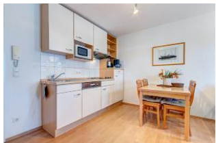
Essbereich und Küchenzeile