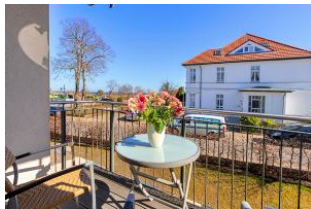
Balkon mit Ausblick