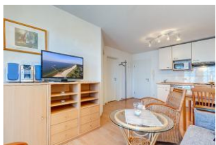
Wohnbereich, Essbereich, Küchenzeile

1. Reihe, direkt an der Strandpromenade mit BALKON und FAHRSTUHL im Haus! Schönes gemütliches 2-Zimmer-Apartment mit moderner guter Ausstattung. Separates Schlafzimmer, Wohnzimmer mit Küchenzeile und Essplatz, Duschbad, Balkon nach Osten - zum Frühstück in der Sonne mit ausschnittweisem Seeblick. Die Wohnung verfügt über einen Tiefgaragen-Pkw-Stellplatz. In der Garage können auch Fahrräder und ähnliches untergestellt werden. In unserer "Villa Germania" nebenan gibt es eine Sauna. Von der "Villa Aquamarina" sind es zum Ortszentrum und der Seebrücke ca. 3 Minuten zu Fuß. Zum Strand sind es 50 m.